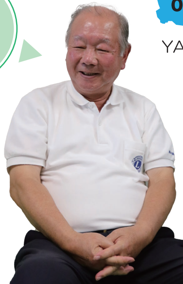
やさしい笑顔の飯田会長